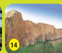
Centro de Educación Medioambiental