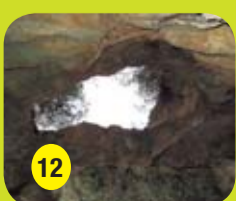
Mirador del Calvari